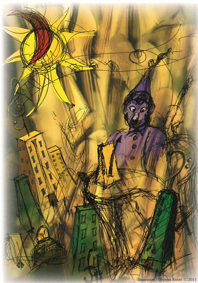
Illustration / Ohyama Kishio © 2011